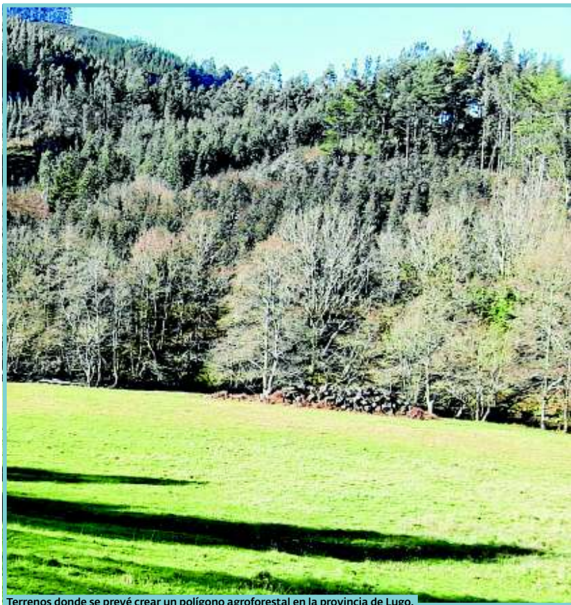
Terrenos donde se prevé crear un polígono agroforestal en la provincia de Lugo.

Por eso, solo con el arrendamiento a través del Banco se puede acceder a estos derechos.