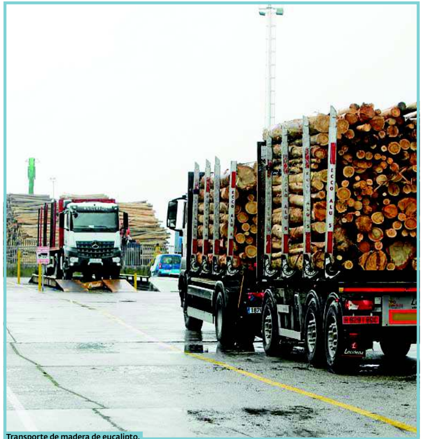
Transporte de madera de eucalipto.

Además, la Consellería do Medio Rural puso en valor una inversión de más de 6,5 millones de euros a lo largo de este año en aportaciones para la buena gobernanza, la creación de nuevas superficies