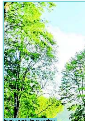
Interior y exterior, en madera.

contrastes interesantes y agregan un toque contemporáneo a los espacios. Por ejemplo, un recurso muy utilizado en interiores con escaleras revestidas en madera de roble claro es combinarlas con barandillas de vidrio y piso de hormigón.