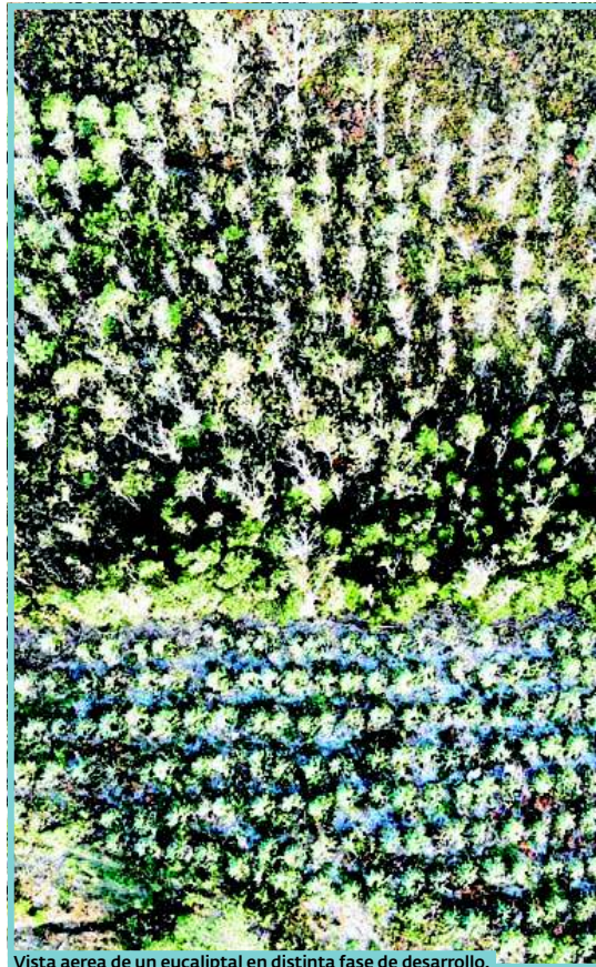
Vista aérea de un eucaliptal en distinta fase de desarrollo.

Esta línea de acción se enmarca en la Agenda de Impulso Forestal-madera, diseñada conjuntamente con los principales agentes del sector para potenciarlo e impulsar la bioeconomía como motor de competitividad, favoreciendo una sociedad saludable, neutra