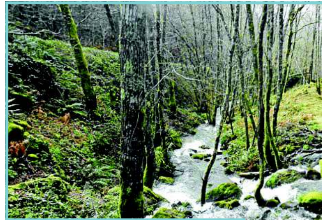
Vistas de frondosas, eucaliptos e piñeiros, na provincia de Lugo.

la catastral— ou para formacións arbóreas pouco frecuentes. A optimización continua da mostraxe permitirá a incorporación de novas parcelas de medición ou o descarte dalgunha das existentes mantendo acoutada a incerteza das estimacións. Ademais, a resiliencia de todo o sistema proposto faiño adaptable a futuras necesidades adicionais de información