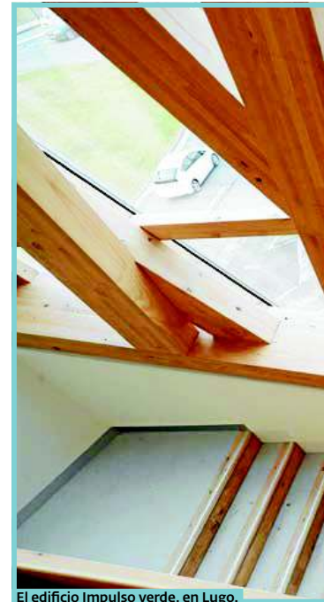
El edificio Impulso verde, en Lugo.

En cuanto a la potencialidad de la construcción de viviendas en